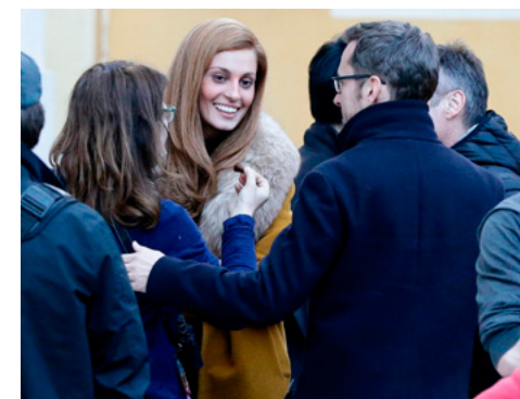
Photo de tournage du film biopic sur la vie de Dalida

Il livre un vibrant portrait de femme, dévoile les ombres quand les lumières se sont éteintes. Line Renaud signe une préface inédite, posant son regard inspiré et ému sur celle qui fut sa grande amie.