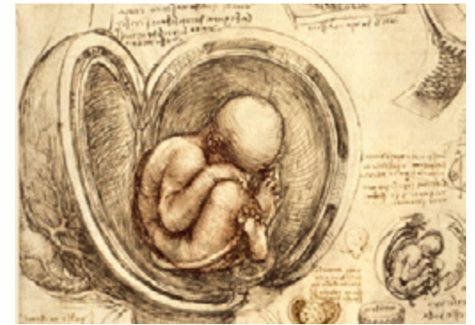
Postface illustrée 16p