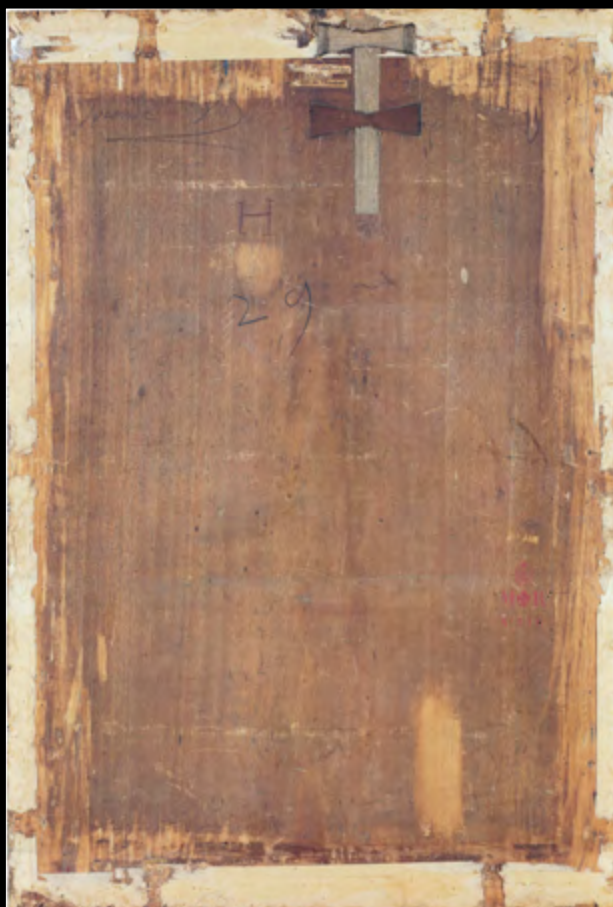
Verso du tableau - les inscriptions décryptées.