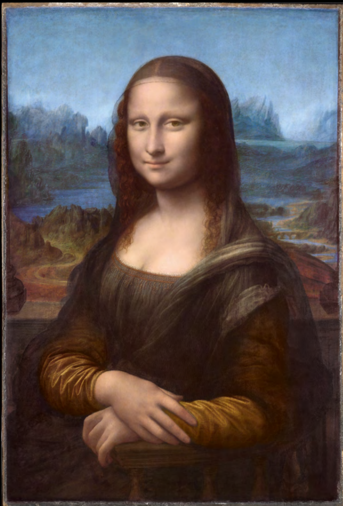
Reconstitution digitale des couleurs d'origine du tableau