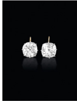
Paire de diadèmes en diamants vers 1870, provenant des collections de l'impératrice Elisabeth d'Autriche (Christie's Genève, 17 mai 2006). Page de gauche : L'impératrice Elisabeth d'Autriche par Franz Xaver Winterhalter, 1865.