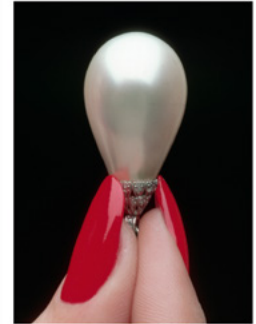
La perle Dufrenoy (Christie's Londres, 4 juillet 1922). Page de gauche : La perle Hope (Christie's Londres, 12 mai 1886).