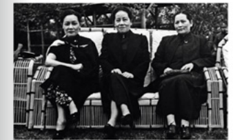
Mei-Ling (Makenna Chong Kai-Shak), Ai-Ling et Ching-Ling Soong, les trois sœurs les plus célèbres de l'histoire de la Chine du XX e siècle. Page de gauche : Bijoux en jade qui furent la propriété des sœurs Soong (Christie's Hong Kong, 2 juin 2015).

46 bijoux ! Certains sont en jade, la pierre qui règne sur la joaillerie asiatique, mais les diamants, les rubis, les émeraudes et les saphirs, souvent montés par les plus grands noms de la joaillerie européenne, sont aussi pré-