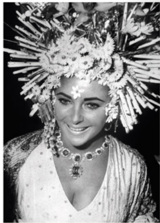
Elizabeth Taylor et son fabuleux collier d'émeraudes signé Bulgari offert par Richard Burton (Christie's Genève, 2 mai 1986).