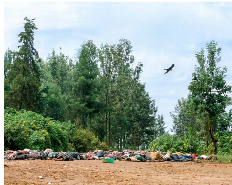
Photo prise en juillet 1994 au Rwanda.